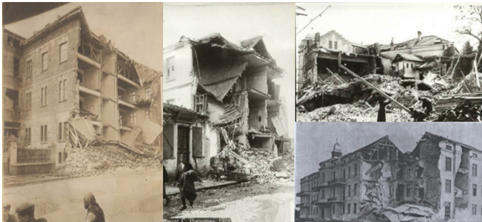
Фиг. 2. Последствия от земетресенията през 1928 г., в градовете Пловдив и Чирпан.

След земетръсната серия от 1928 г., в страната настъпва затишие на силните земетресения с M_w^{36.5} , което продължава и до сегашният момент.