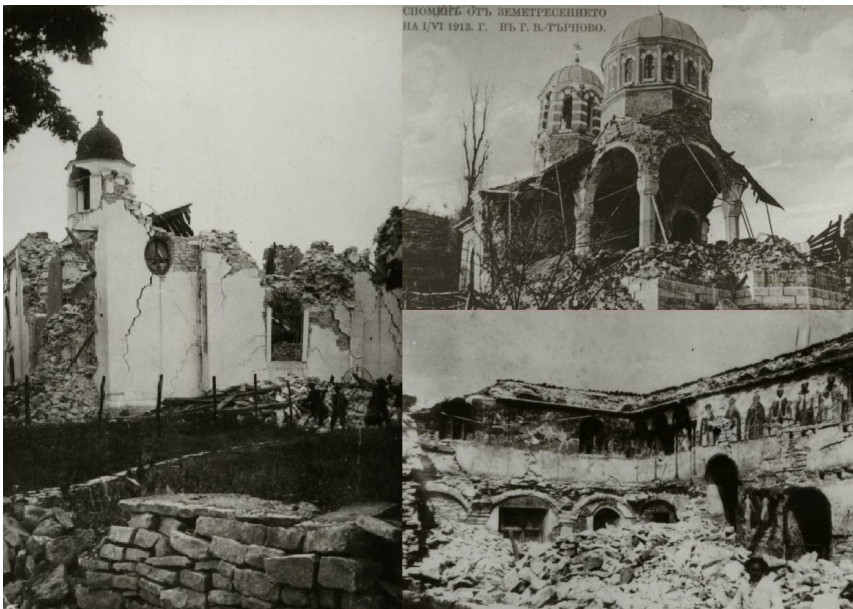
Фиг. 1. Разрушения в градовете Горна Оряховица и Велико Търново от силното земетресение с магнитуд M_w=6.8 , реализирано през 1913 година.

Последствията от земетресението са описани в работата на Спас Вацов от 1923 г. Някои от разрушенията, установени в градовете Горна Оряховица и Търново са представени на Фиг. 1.